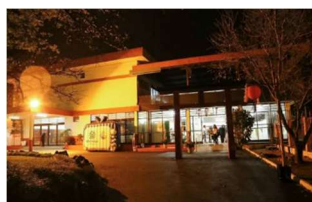
ACEA Apucarana - PR