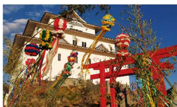
Templo Assaí - PR