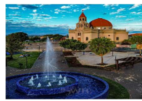
Uraí - PR