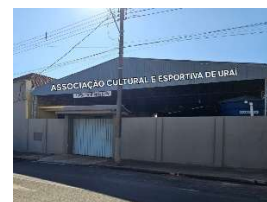
ACEU Uraí - PR