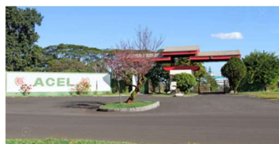
ACEL Londrina - PR