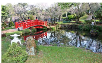
ACEA Apucarana - PR