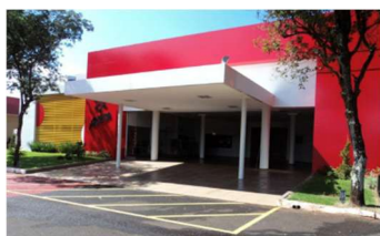
ACEMA Maringá - PR

OBSERVAÇÃO: Esta programação foi elaborada em Dez/25 , de acordo com a disponibilidade das Associações Japonesas locais e condições das Cias Aéreas, sujeitas a alterações sem aviso prévio conforme a variação das mesmas